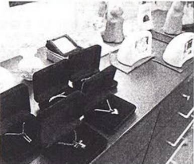
④ミニ骨つぼは墓の代わりに⑤ペンダントやオブジェなどさまざまなタイプの手元供養品